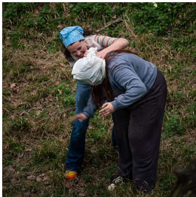
Dans les douves du château du Plessis-Macé.